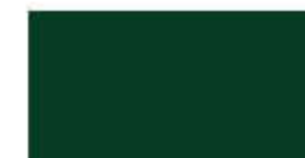
Nagoya Green 904