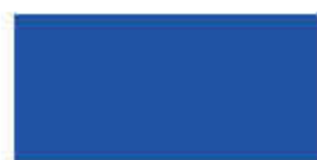
Ultra Blue 701

* PERMASOL ROOF PAINT tidak dapat digunakan pada permukaan genteng berglazur.