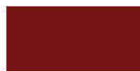
Tile Red 702