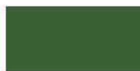
Oxide Green 706