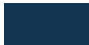
Deep Blue 707