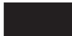
Coffee Black 703