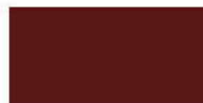
Oxide Red 705